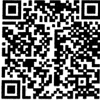
QR Code สพตประชาสัมพันธ์ รับสมัครเลือกตั้ง